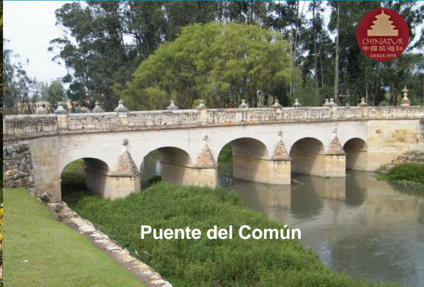
Puente del Común