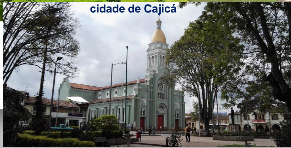
cidade de Cajicá